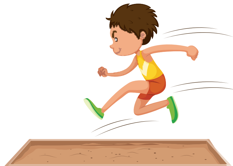
skok w dal