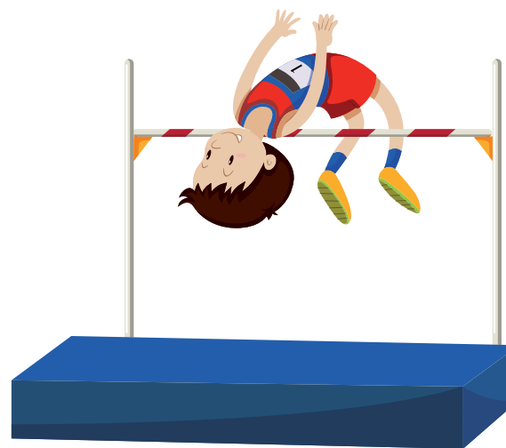
skok o tyczce